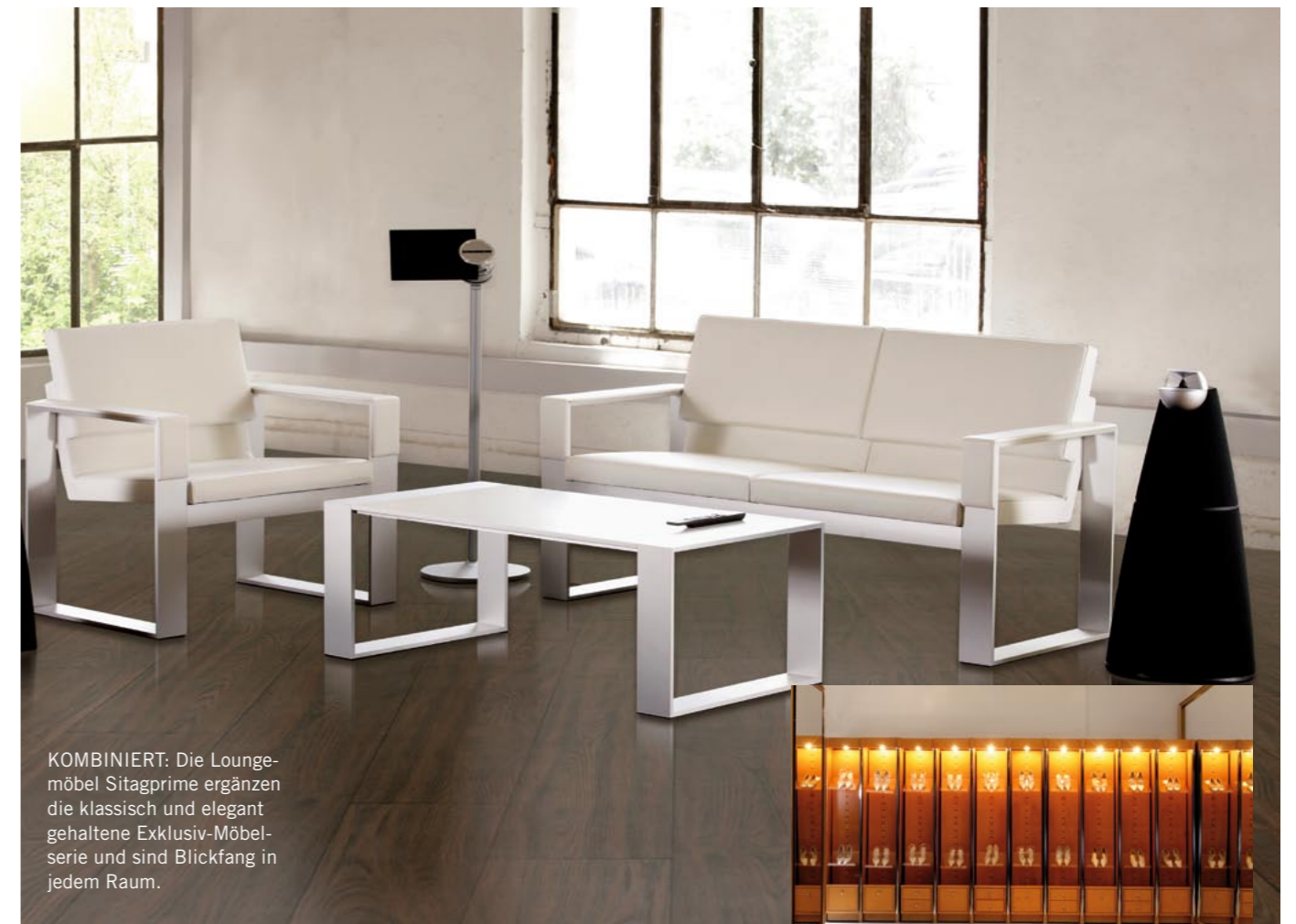
KOMBINIERT: Die Loungemöbel Sitagprime ergänzen die klassisch und elegant gehaltene Exklusiv-Möbelserie und sind Blickfang in jedem Raum.

Zu einem stilvollen Ambiente passen allerdings weder Kabelsalat noch unschöne Rechner oder Drucker. Deshalb findet neben dem Schreibtisch der sogenannte Techniktisch Platz: Rechner, Drucker und Verkabelung verschwinden vollständig im Unterbau des Tisches.